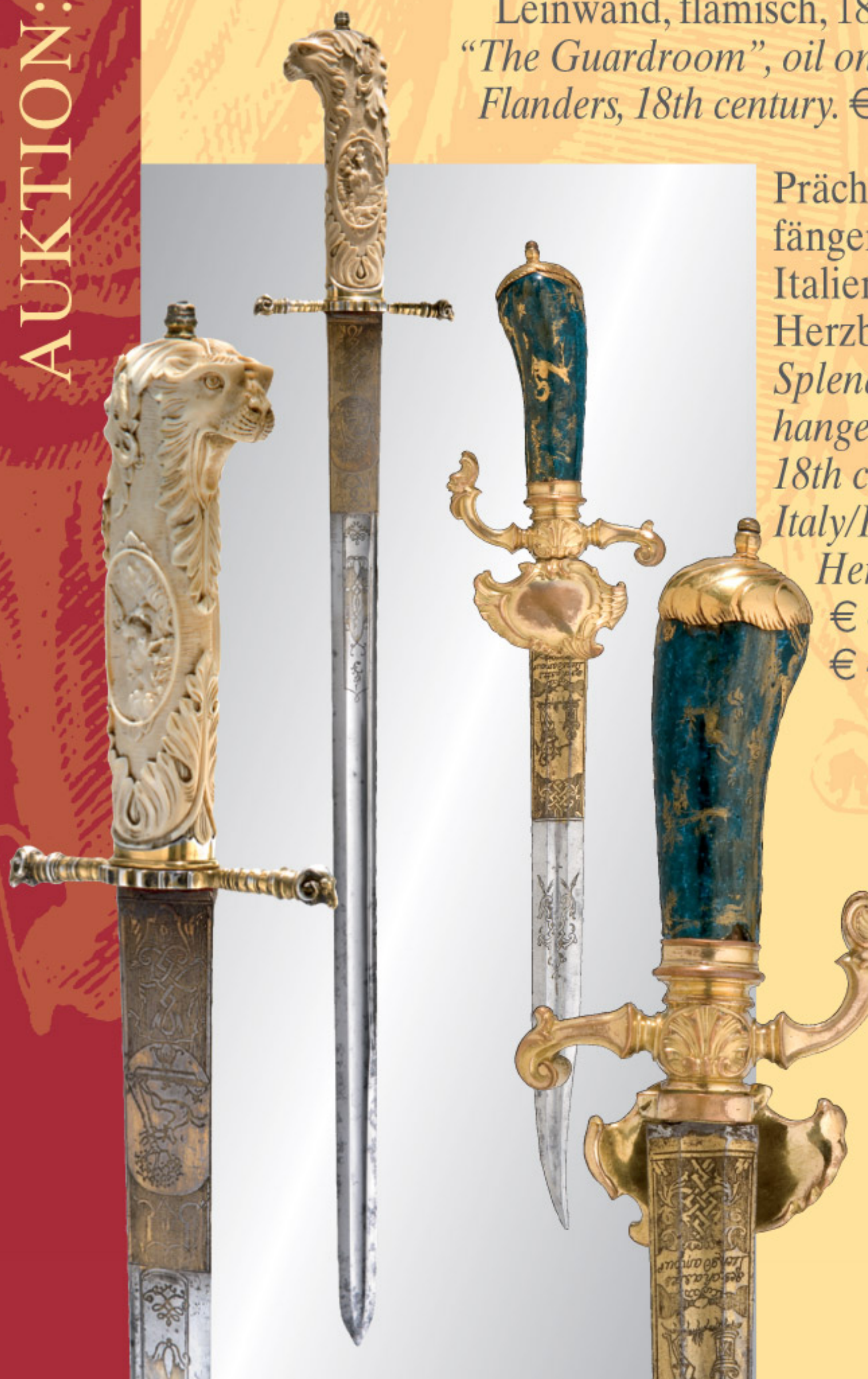
Prächtige Hirschfänger des 18. Jhdts, Italien/Frankreich, Herzberg Splendid hunting hangers of the 18th century, Italy/France, Herzberg. € 4.800 / € 4.000