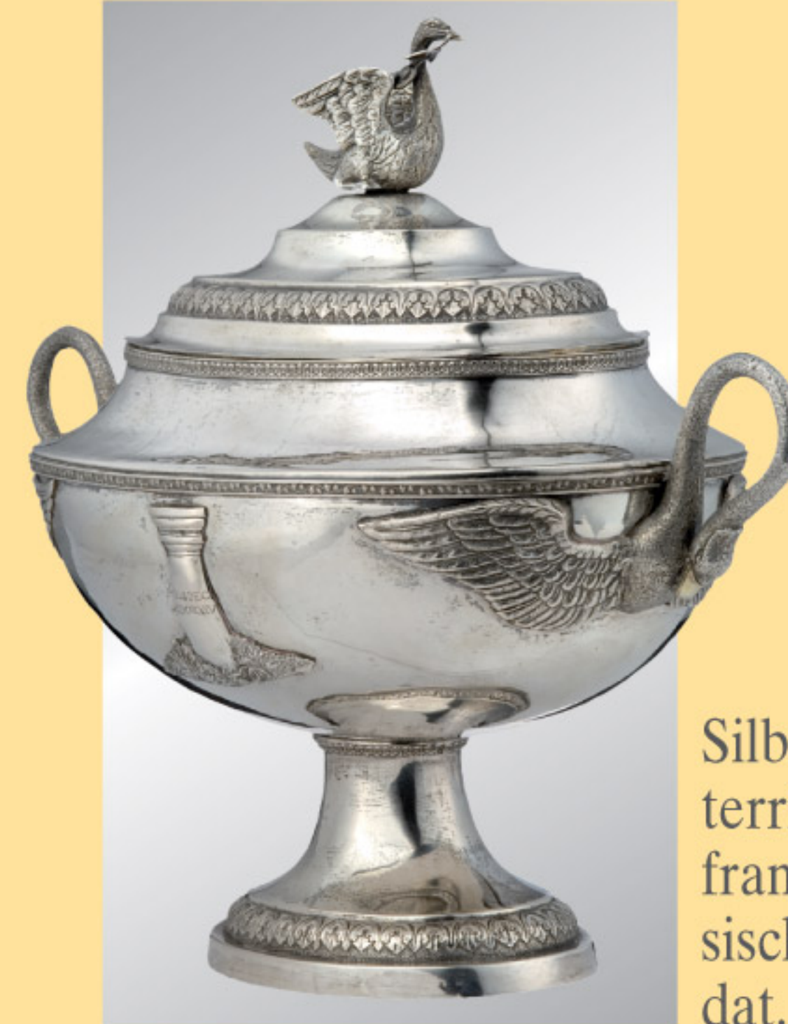
A silver tureen, France (?), dated 1825. € 4.500