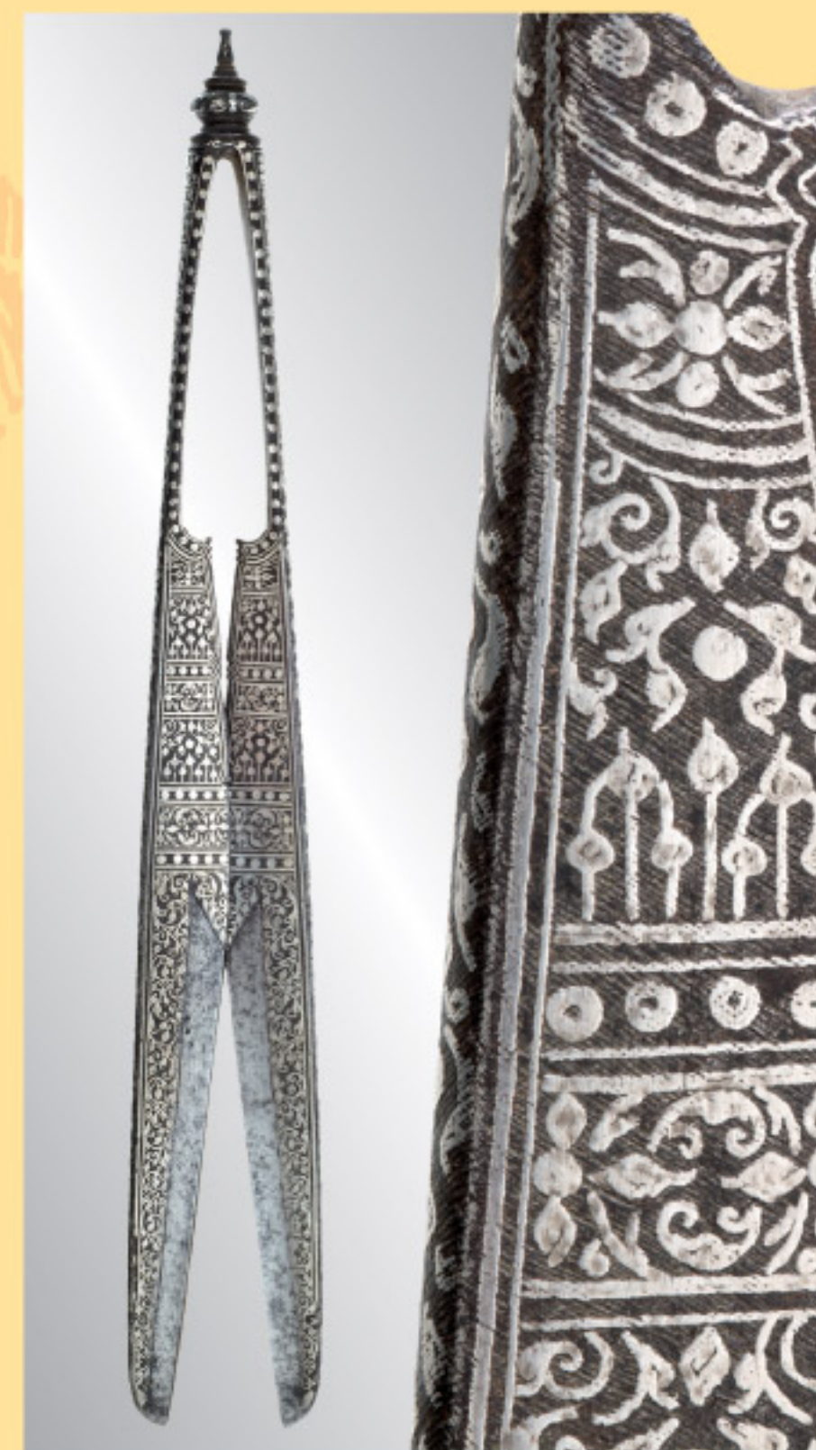
Silbertauschierte Renaissance-Schere, Italien, 16. Jhdt. A pair of Renaissance scissors, Italy, 16th century. € 2.500