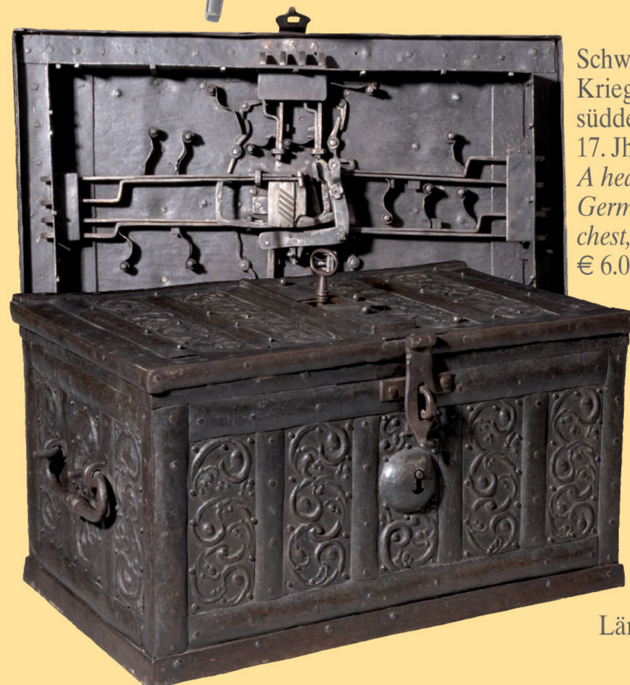
Schwere Kriegskasse, süddeutsch, 17. Jhdt. A heavy South German war chest, 17th cent. € 6.000