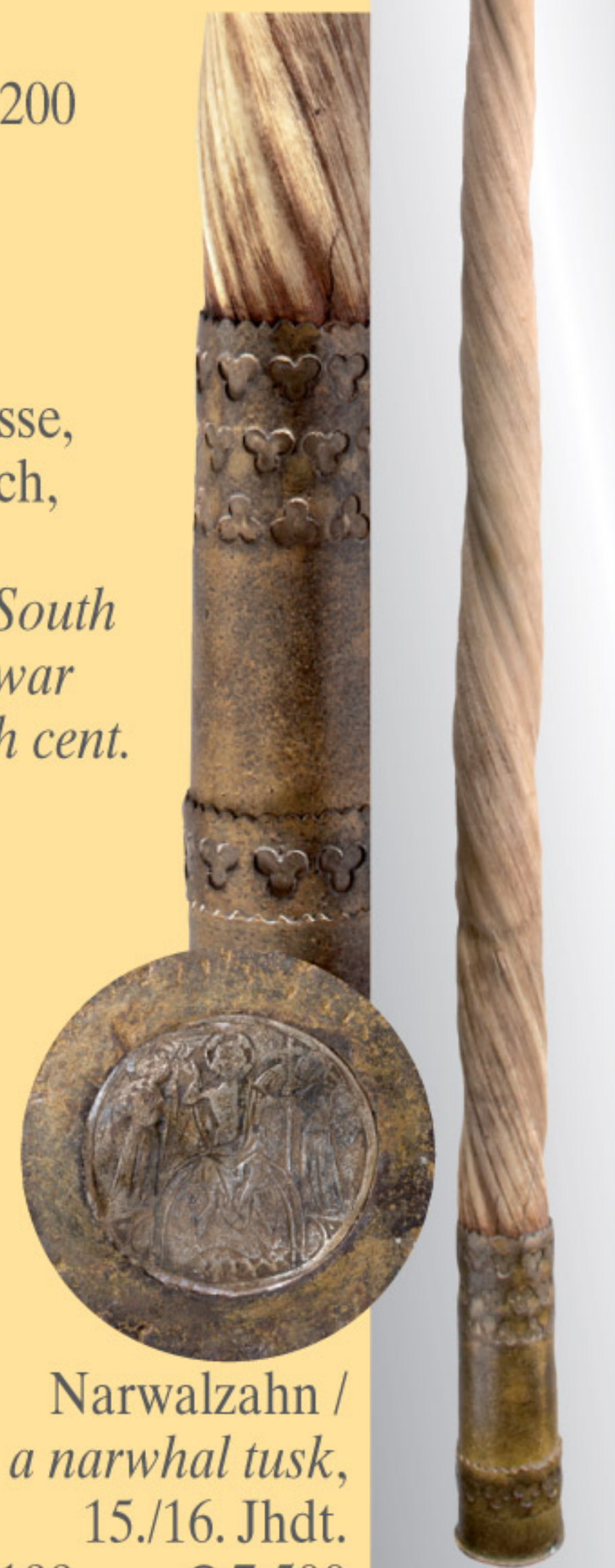
Narwalzahn / a narwhal tusk, 15./16. Jhdt. Länge 199 cm. € 7.500