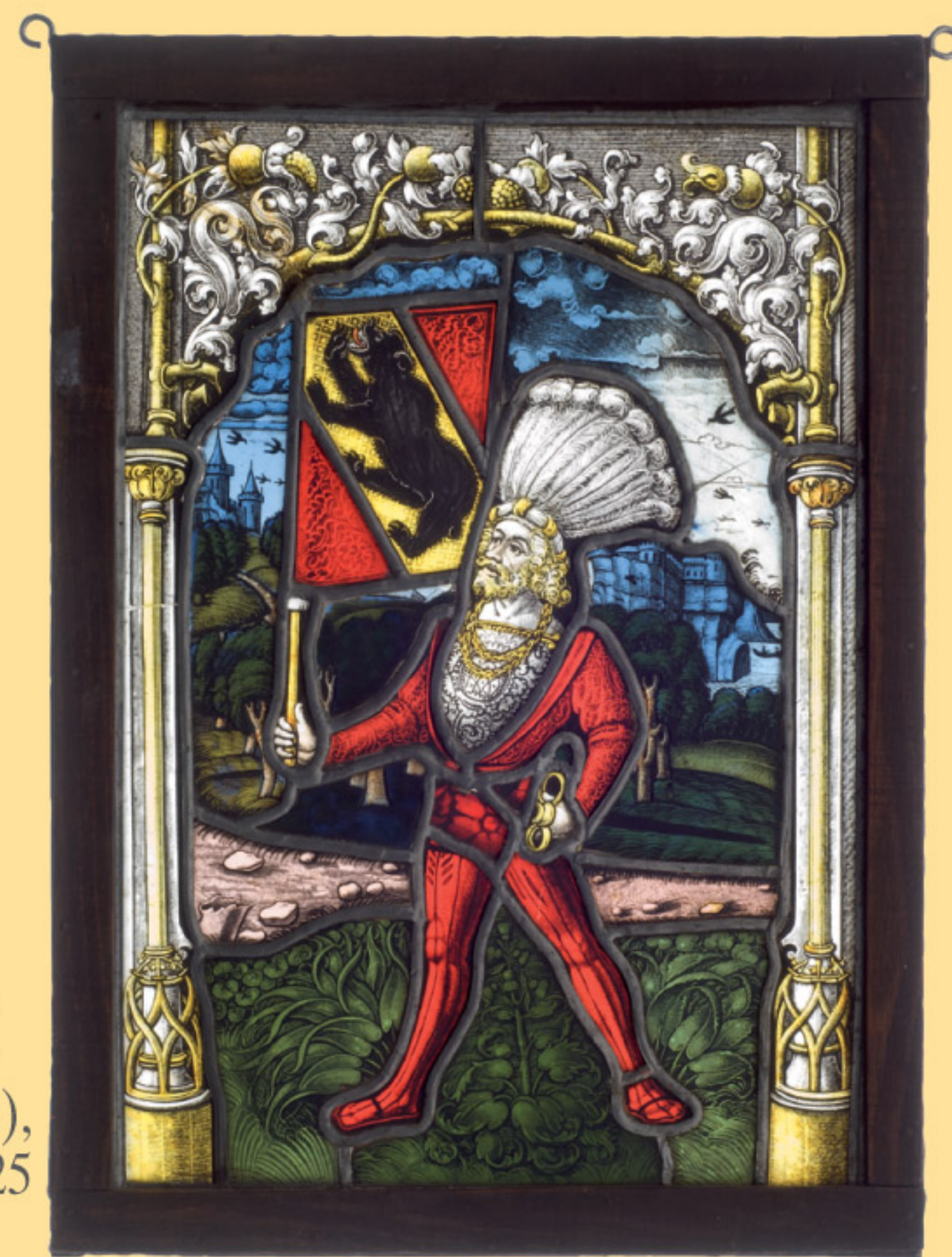
Bleiglas-Wappenscheibe, Schweiz, 16.Jhdt. A coat of arms leaded glass panel, Switzerland, 16th century. € 1.500