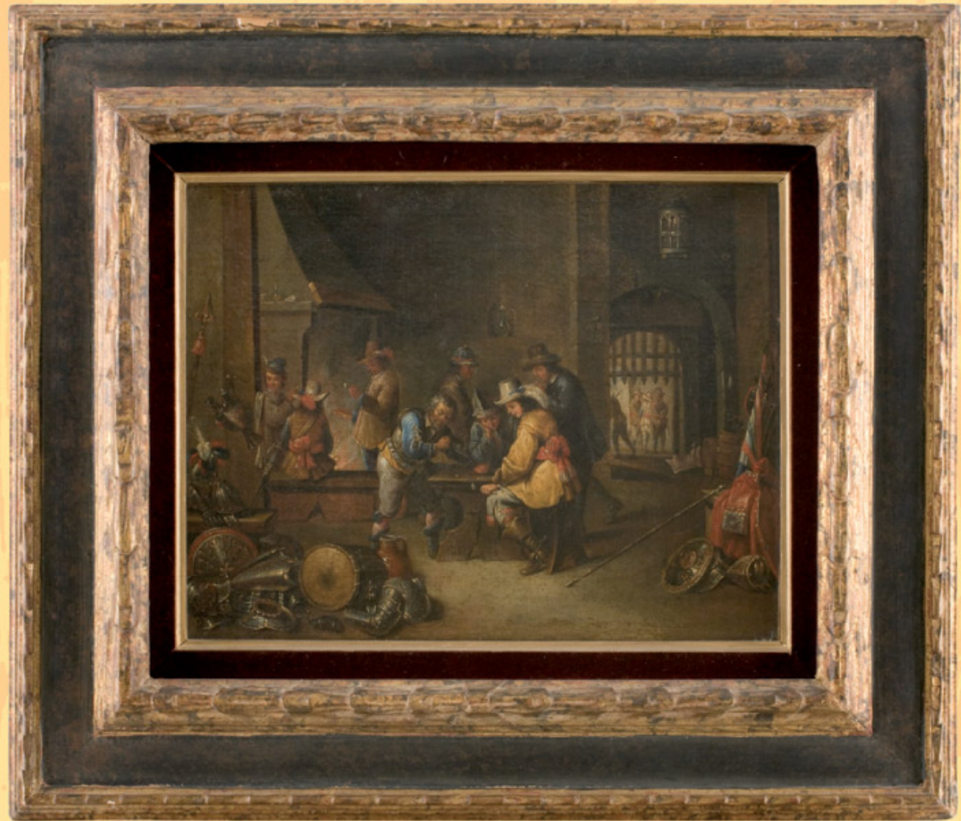
«Die Wachstube», Öl auf Leinwand, flämisch, 18.Jhdt. “The Guardroom”, oil on canvas, Flanders, 18th century. € 3.500