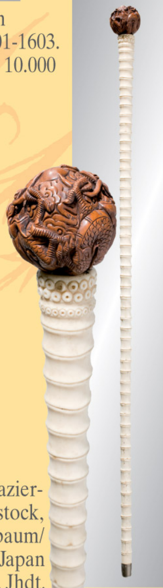
Spazierstock, Buchsbaum/Bein, Japan 19./20. Jhdt. A fine Japanese walking stick, boxwood/bone, 19th/20th cent. € 600