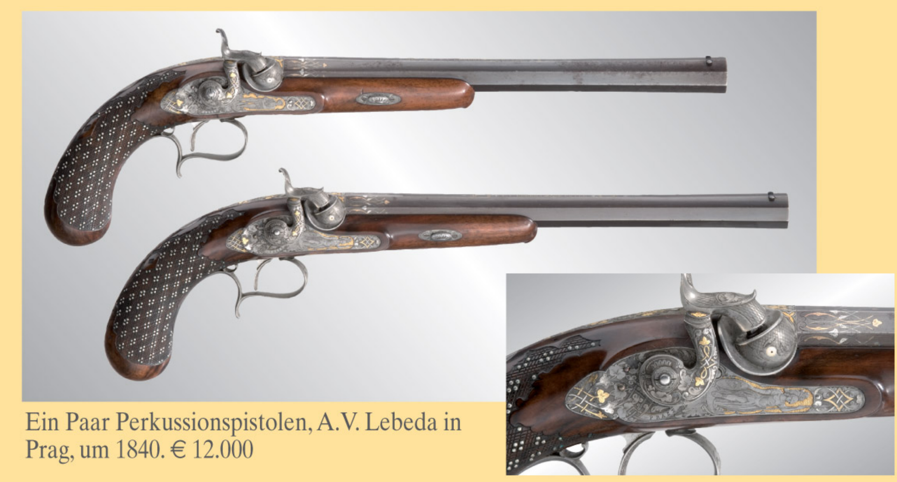
Ein Paar Perkussionspistolen, A. V. Lebeda in Prag, um 1840. € 12.000