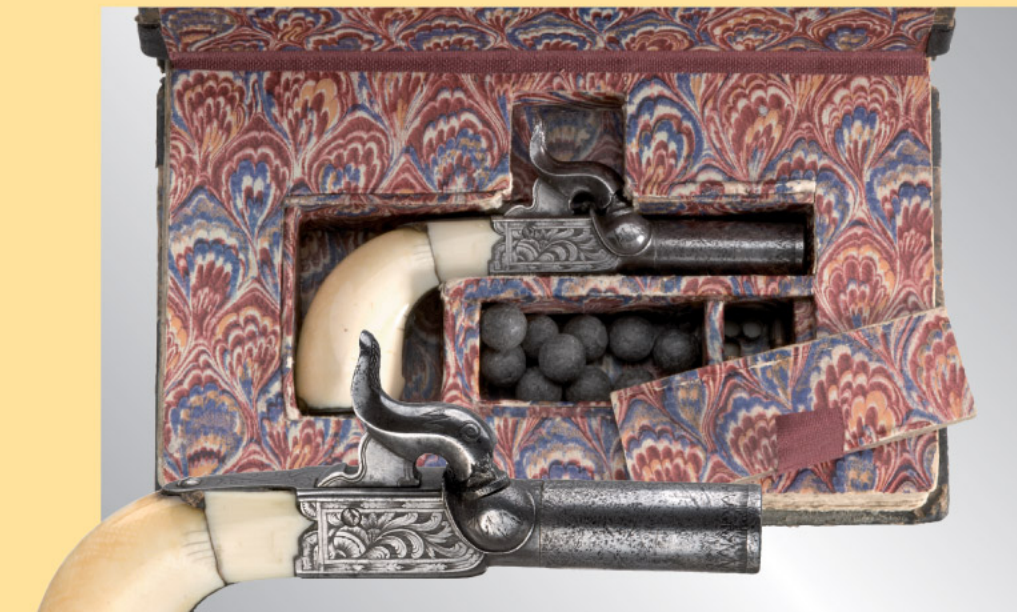
Victoria Luise (1892-1980) – Perkussionsterzerol der Preußen-Prinzessin A percussion pistol of the Prussian Princess. € 3.500