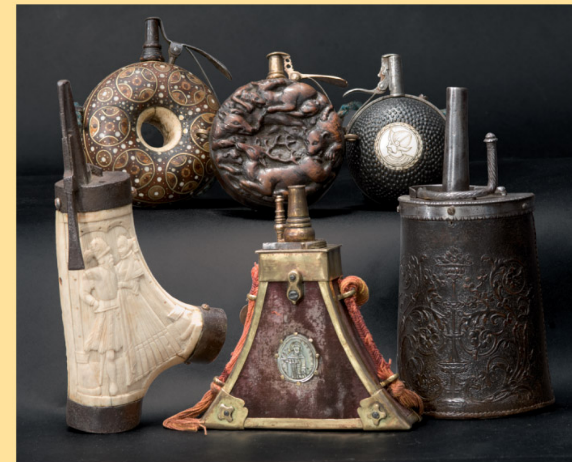
Frühe Pulverflaschen aus dem 16. und 17. Jahrhundert Early powderhorns of the 16th and 17th century