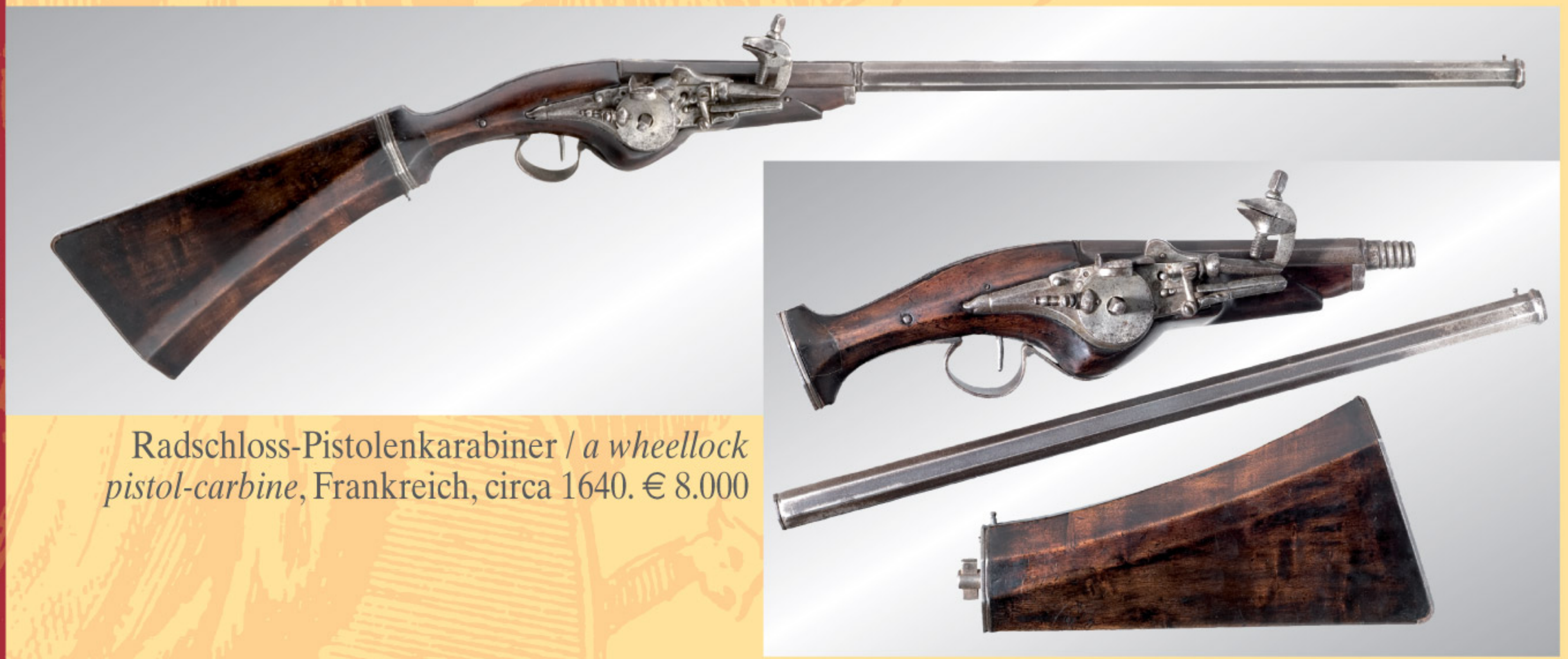
Radschloss-Pistolenkarabiner / a wheellock pistol-carbine, Frankreich, circa 1640. € 8.000