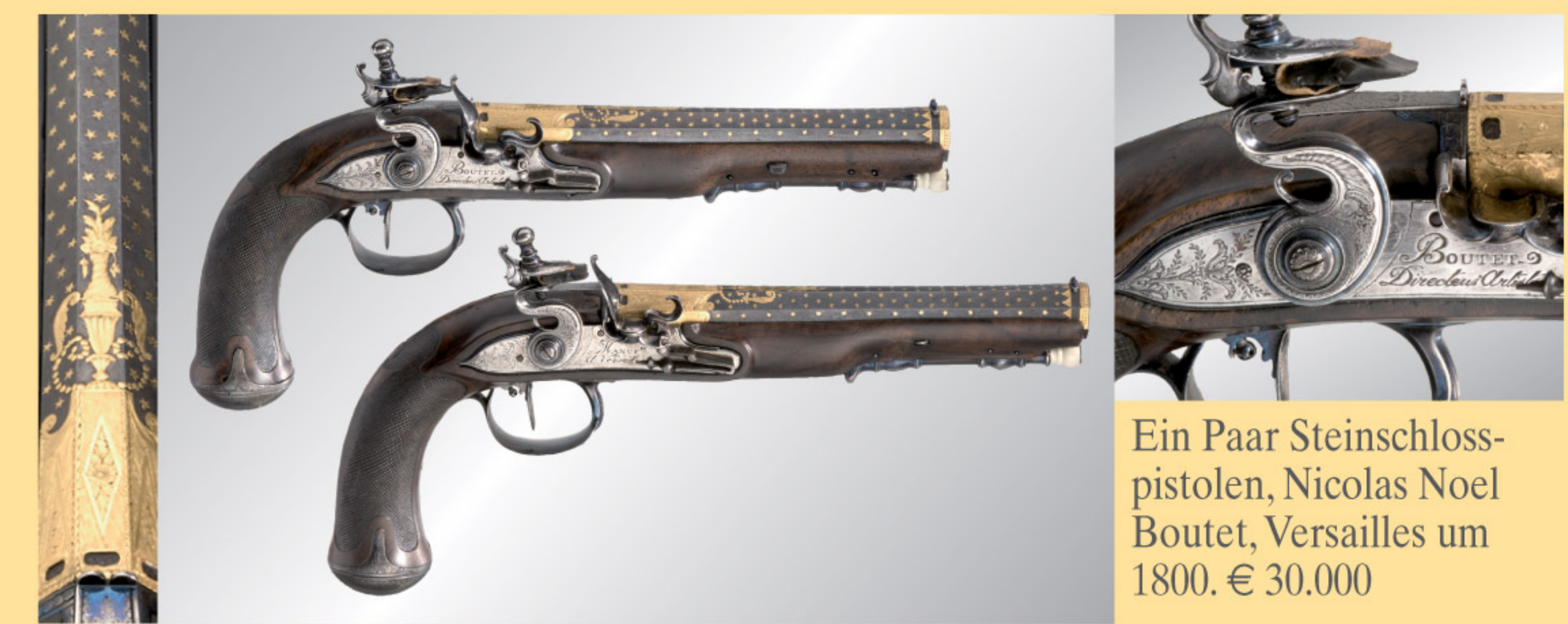
Ein Paar Steinschlosspistolen, Nicolas Noel Boutet, Versailles um 1800. € 30.000