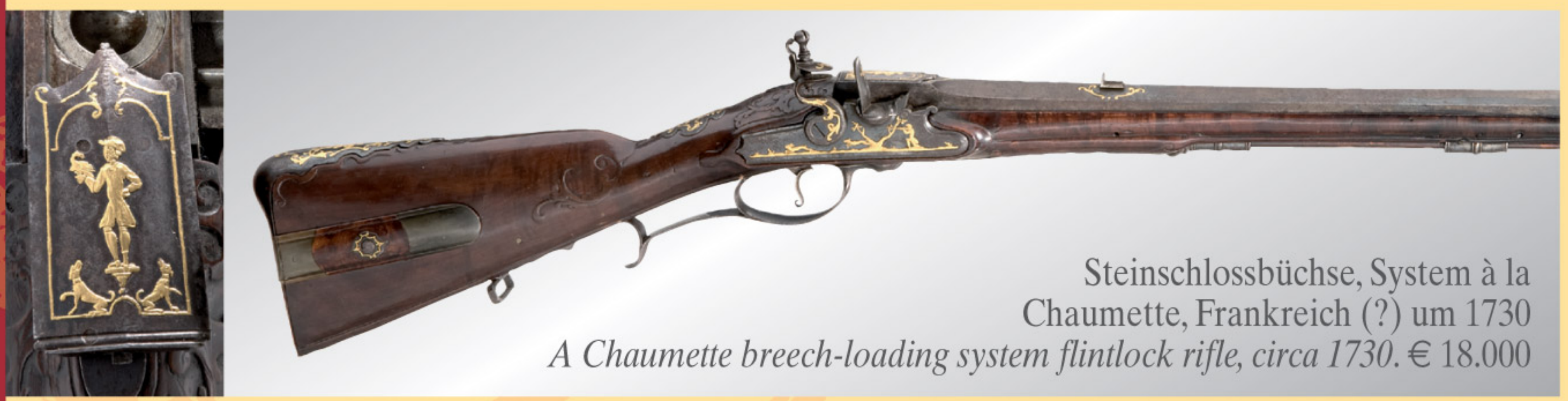
Steinschlossbüchse, System à la Chaumette, Frankreich (?) um 1730 A Chaumette breech-loading system flintlock rifle, circa 1730. € 18.000