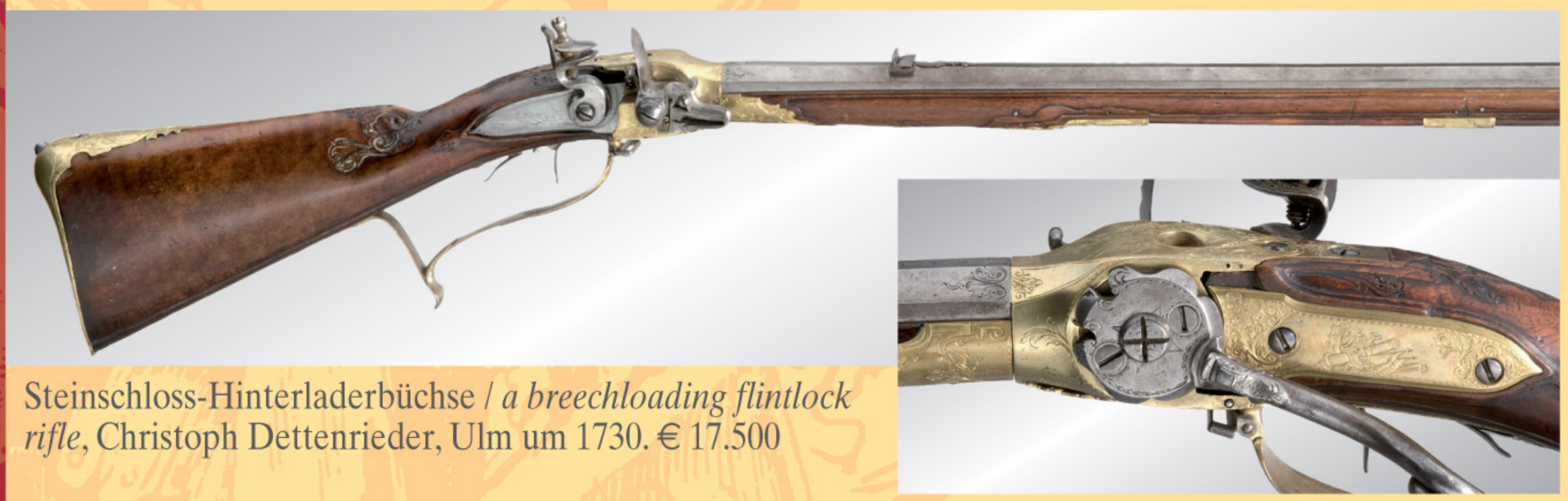
Steinschloss-Hinterladerbüchse / a breechloading flintlock rifle, Christoph Dettenrieder, Ulm um 1730. € 17.500