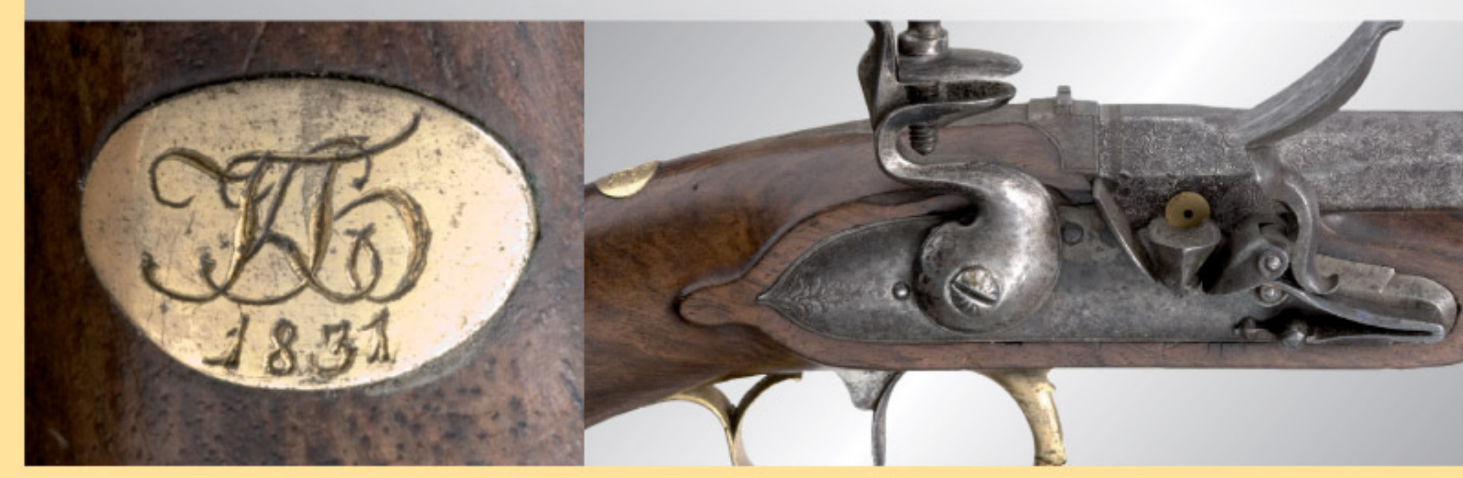
Ein Paar russische Offiziers-Steinschlosspistolen, datiert 1831 A pair of officer's flintlock pistols, Russia, dated 1831. € 35.000