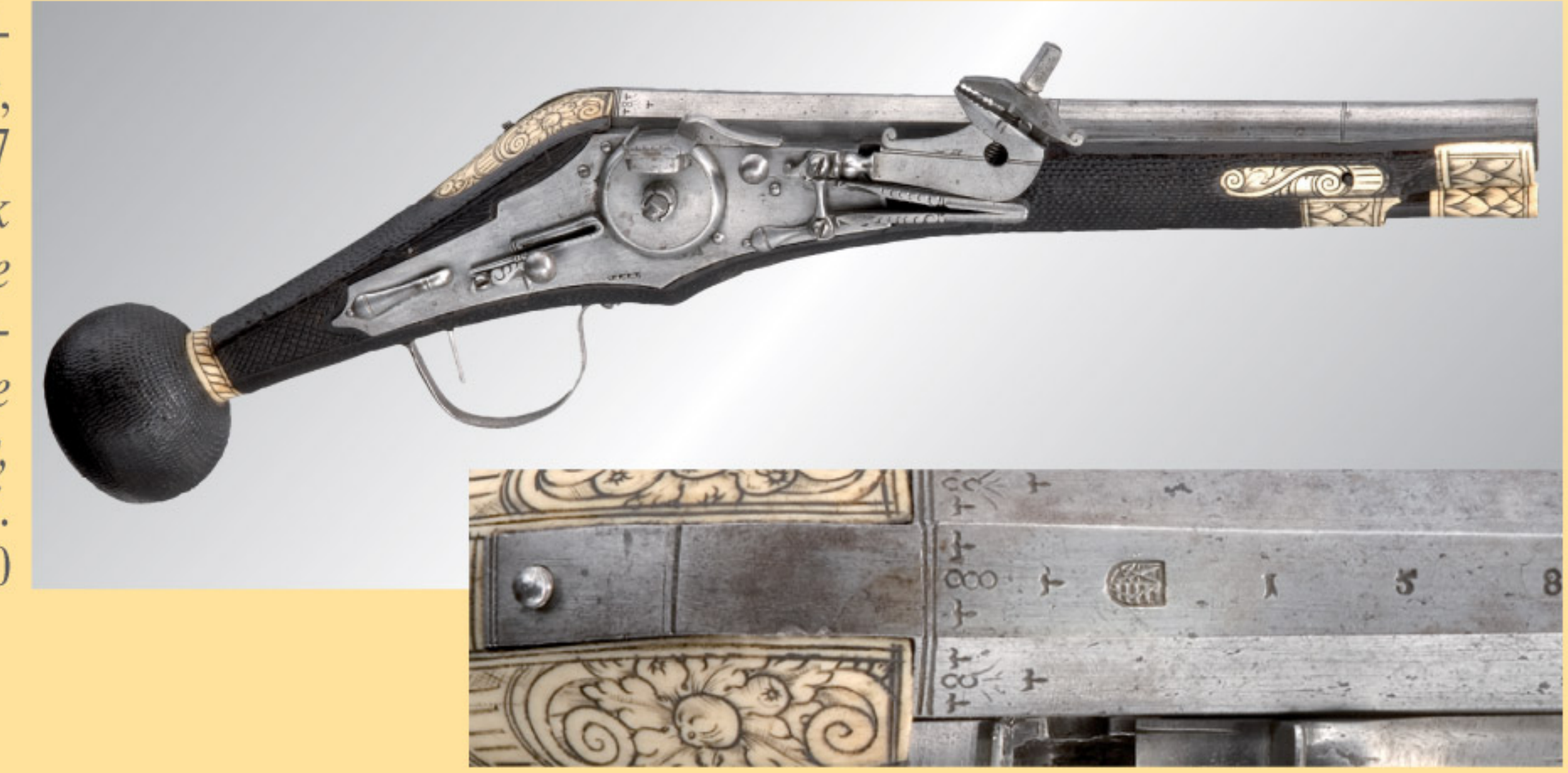
Sächsischer Radschlosspuffer, datiert 1587 A wheellock puffer for the Saxon Prince-Elector's Palace Life Guards, dated 1587. € 18.000